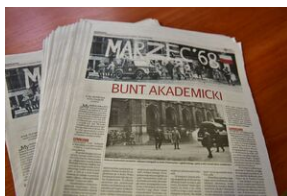
Panel dyskusyjny na „Przystanku Historia” IPN.