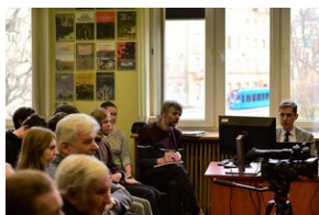
Panel dyskusyjny na „Przystanku Historia” IPN.