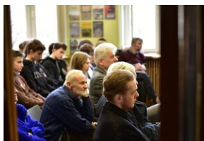
Panel dyskusyjny na „Przystanku Historia” IPN.