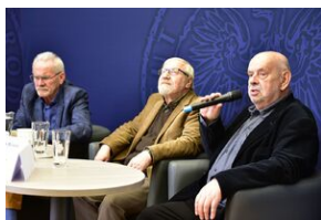
Panel dyskusyjny na „Przystanku Historia” IPN.