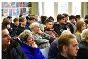
Panel dyskusyjny na „Przystanku Historia” IPN.