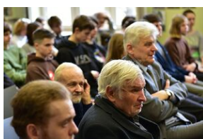
Panel dyskusyjny na „Przystanku Historia” IPN.