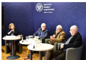
Panel dyskusyjny na „Przystanku Historia” IPN.