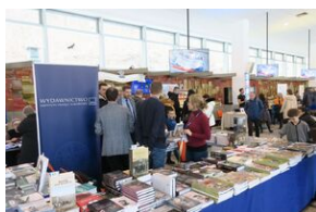
Wydawnictwo IPN na 5. Sąddeckich Targach Książki w Krynicy.