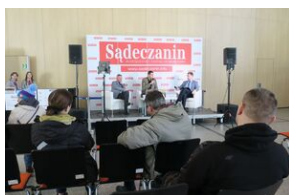
Wydawnictwo IPN na 5. Sąddeckich Targach Książki w Krynicy.