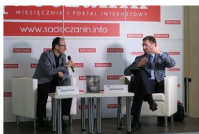
Wydawnictwo IPN na 5. Sąddeckich Targach Książki w Krynicy.