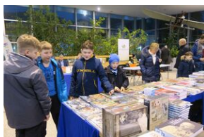
Wydawnictwo IPN na 5. Sąddeckich Targach Książki w Krynicy.