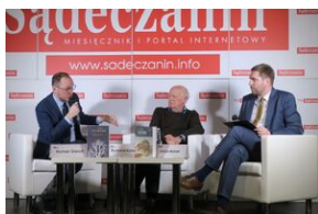
Wydawnictwo IPN na 5. Sąddeckich Targach Książki w Krynicy.