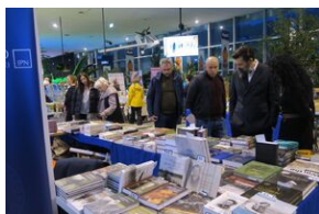
Wydawnictwo IPN na 5. Sąddeckich Targach Książki w Krynicy.