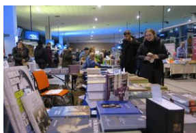
Wydawnictwo IPN na 5. Sąddeckich Targach Książki w Krynicy.