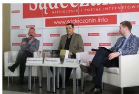
Wydawnictwo IPN na 5. Sąddeckich Targach Książki w Krynicy.