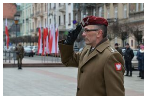
81. rocznica przekształcenia ZWZ w Armię Krajową.