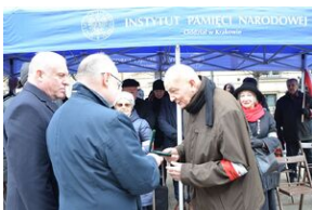
81. rocznica przekształcenia ZWZ w Armię Krajową.