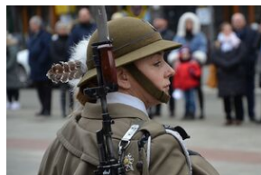
81. rocznica przekształcenia ZWZ w Armię Krajową.