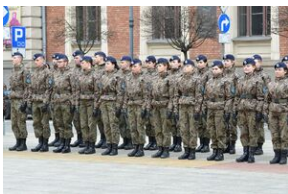
81. rocznica przekształcenia ZWZ w Armię Krajową.