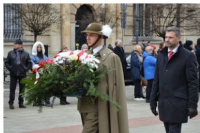
81. rocznica przekształcenia ZWZ w Armię Krajową.