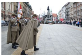
81. rocznica przekształcenia ZWZ w Armię Krajową.

14 lutego 1942 r. do gen. Stefana Roweckiego „Grota” dotarła z Londynu depesza, w której Naczelny Wódz gen. Władysław Sikorski rozkazywał: