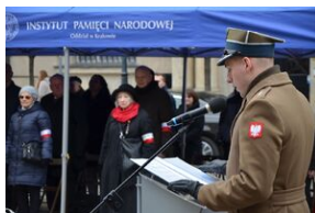
81. rocznica przekształcenia ZWZ w Armię Krajową.