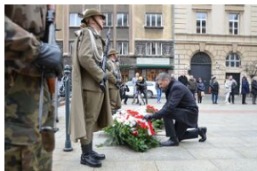
81. rocznica przekształcenia ZWZ w Armię Krajową.