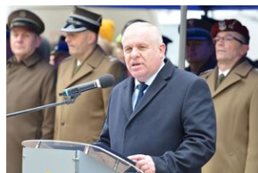
81. rocznica przekształcenia ZWZ w Armię Krajową.