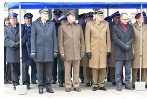
81. rocznica przekształcenia ZWZ w Armię Krajową.