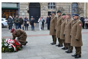
81. rocznica przekształcenia ZWZ w Armię Krajową.