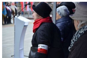
81. rocznica przekształcenia ZWZ w Armię Krajową.