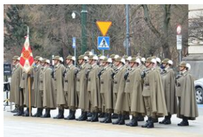
81. rocznica przekształcenia ZWZ w Armię Krajową.