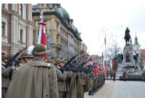
81. rocznica przekształcenia ZWZ w Armię Krajową. Fot.