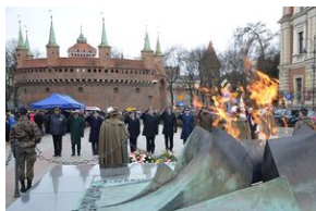
81. rocznica przekształcenia ZWZ w Armię Krajową.