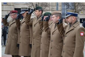
81. rocznica przekształcenia ZWZ w Armię Krajową.