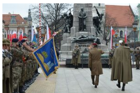
81. rocznica przekształcenia ZWZ w Armię Krajową.