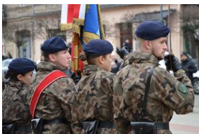
81. rocznica przekształcenia ZWZ w Armię Krajową.