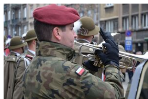
81. rocznica przekształcenia ZWZ w Armię Krajową. Fot.