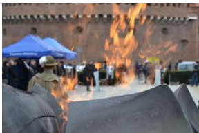
81. rocznica przekształcenia ZWZ w Armię Krajową.