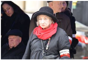
81. rocznica przekształcenia ZWZ w Armię Krajową.