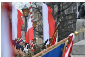
81. rocznica przekształcenia ZWZ w Armię Krajową.