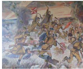
Kościół w Sołach. Fresk przedstawiający zwycięstwo nad bolszewikami w Bitwie Warszawskiej