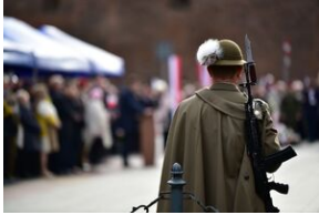
Narodowe Święto Niepodległości.