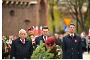
Narodowe Święto Niepodległości.