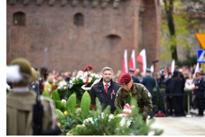
Narodowe Święto Niepodległości.