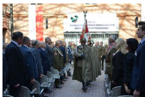
Święto terenowych organów wykonawczych MON.