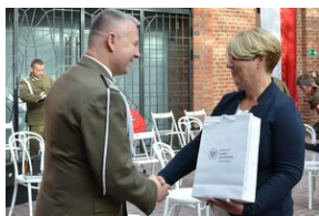
Święto terenowych organów wykonawczych MON.