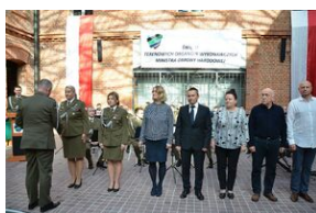
Święto terenowych organów