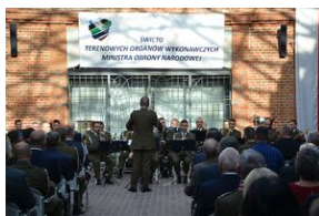
Święto terenowych organów wykonawczych MON.