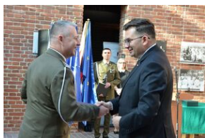
Święto terenowych organów wykonawczych MON.