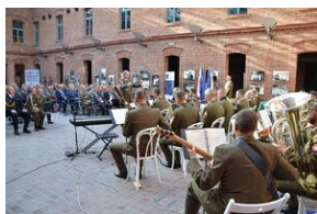
Święto terenowych organów wykonawczych MON.