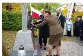
W Rabce-Zdroju odsłonięto pomnik legionistów.