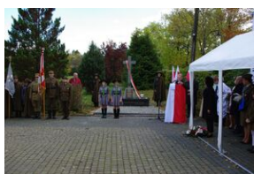
W Rabce-Zdroju odsłonięto pomnik legionistów.