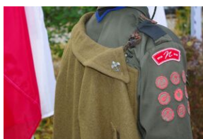
W Rabce-Zdroju odsłonięto pomnik legionistów.