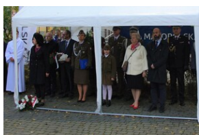
W Rabce-Zdroju odsłonięto pomnik legionistów.