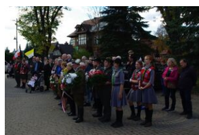
W Rabce-Zdroju odsłonięto pomnik legionistów.