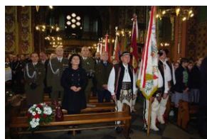
W Rabce-Zdroju odsłonięto pomnik legionistów.