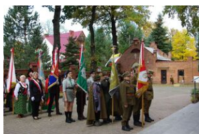
W Rabce-Zdroju odsłonięto pomnik legionistów.