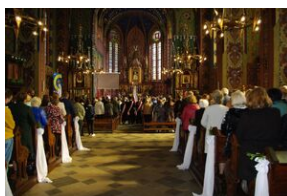
W Rabce-Zdroju odsłonięto pomnik legionistów.