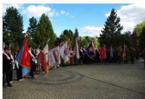
W Rabce-Zdroju odsłonięto pomnik legionistów.