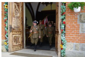
W Rabce-Zdroju odsłonięto pomnik legionistów.