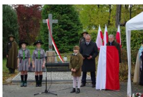
W Rabce-Zdroju odsłonięto pomnik legionistów.