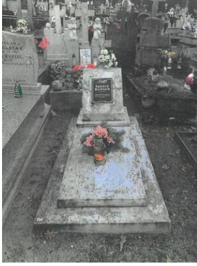
Grób Ignacego Boducha „Tarzana” przed remontem