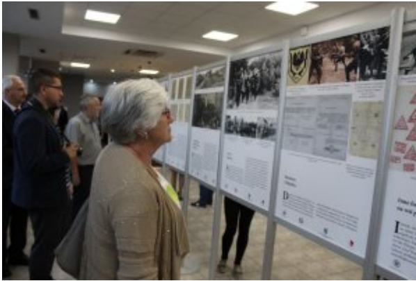
Konferencja „Wieś polska podczas okupacji niemieckiej” w Kielcach