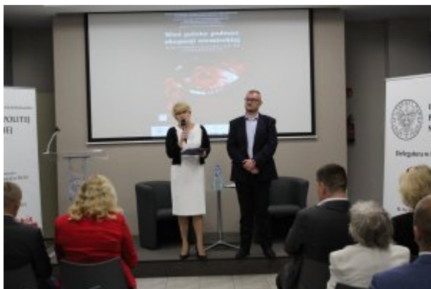
Konferencja „Wieś polska podczas okupacji niemieckiej” w Kielcach

12 czerwca 2018, Kielce – konferencja popularnonaukowa w Centrum Edukacyjnym „Przystanek Historia” IPN w Kielcach