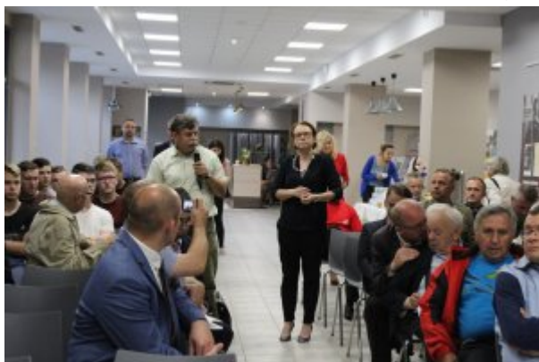
Konferencja „Wieś polska podczas okupacji niemieckiej” w Kielcach