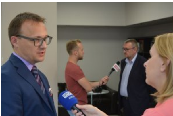
Konferencja prasowa w kieleckim Centrum Edukacyjnym IPN na temat Dnia Walki i Męczeństwa Wsi Polskiej

11 lipca 2018 – ukazał się „Kuryer Kielecki” – dodatek specjalny do dziennika „Echo Dnia” z okazji 75. rocznicy pacyfikacji Michniowa