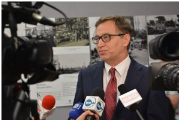
Konferencja prasowa w kieleckim Centrum Edukacyjnym IPN na temat Dnia Walki i Męczeństwa Wsi Polskiej