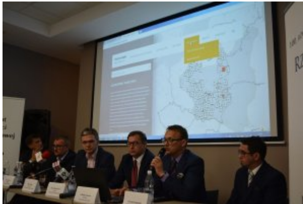
Konferencja prasowa w kieleckim Centrum Edukacyjnym IPN na temat Dnia Walki i Męczeństwa Wsi Polskiej