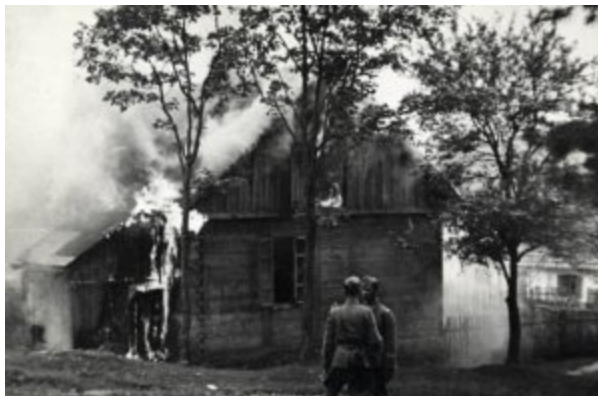
Płonąca wieś, Michniów, 12 VII 1943 r.

Niemal natychmiast po zakończeniu działań wojennych jesienią 1939 r. okupant niemiecki rozpoczął wysiedlenia ludności polskiej z ziem włączonych do III Rzeszy. Wśród wysiedlonych