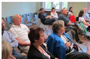
Obrona Krzyża w Nowej Hucie. Co wiemy a czego jeszcze nie?