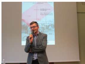
Obrona Krzyża w Nowej Hucie. Co wiemy a czego jeszcze nie?