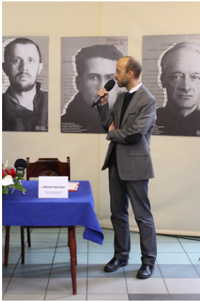
Prezentacja wystawy IPN „OPERACJA (ANTY)POLSKA NKWD 1937-1938”