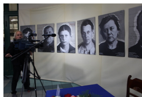
Prezentacja wystawy IPN „OPERACJA (ANTY)POLSKA NKWD 1937-1938”