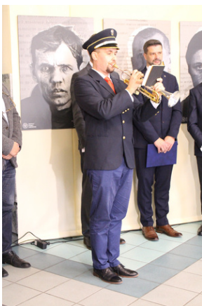
Prezentacja wystawy IPN „OPERACJA (ANTY)POLSKA NKWD 1937-1938”