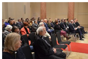
Debata o polityce historycznej.