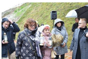
Tablica pamięci ofiar egzekucji w forcie „Krzyszawice”.