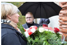
Tablica pamięci ofiar egzekucji w forcie „Krzyszawice”.