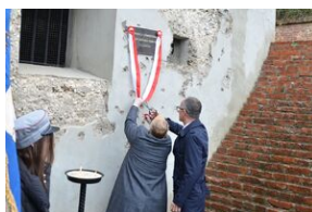
Tablica pamięci ofiar egzekucji w forcie „Krzyszawice”.