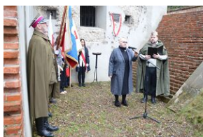
Tablica pamięci ofiar egzekucji w forcie „Krzyszawice”.