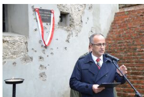
Tablica pamięci ofiar egzekucji w forcie „Krzyszawice”.