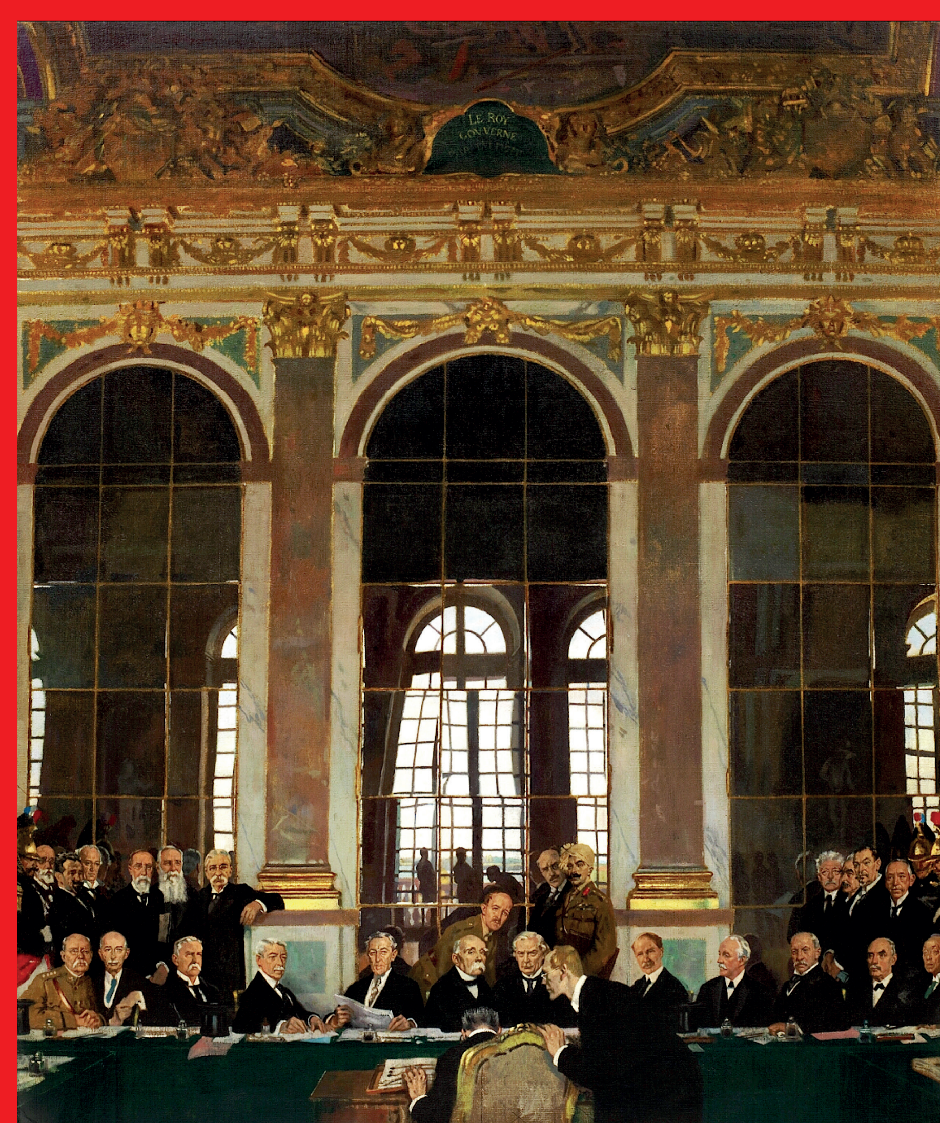
William Orpen, Podpisanie Traktatu Pokojowego w Sali Zwierciadlanej pałacu wersalskiego, 28 czerwca 1919 r. (1919), olej na płótnie, Imperial War Museum