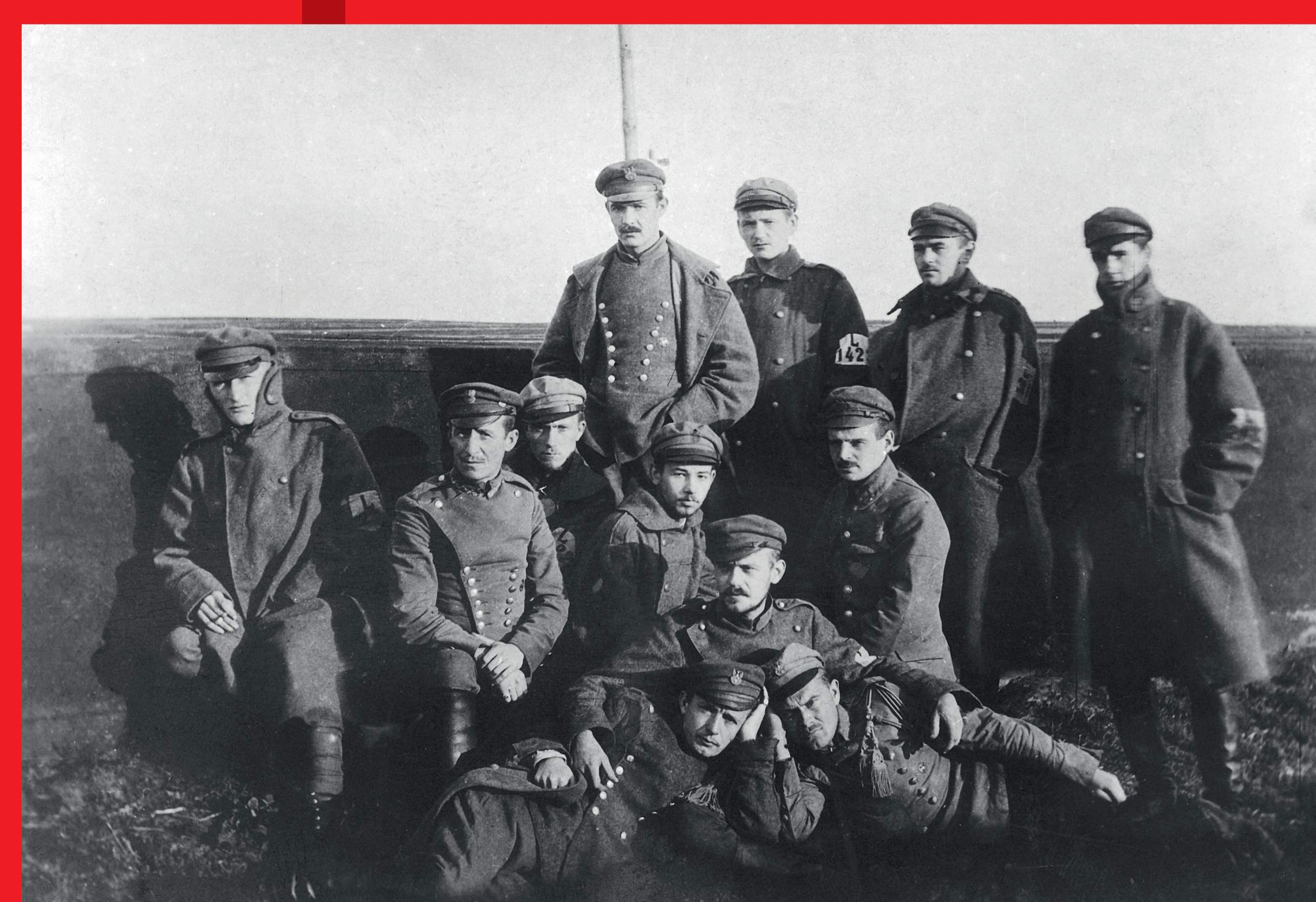
Żołnierze Legionów Polskich internowani w Szczepiornie po odmowie złożenia przysięgi na wierność cesarzowi Niemiec, 1917 r. / NAC