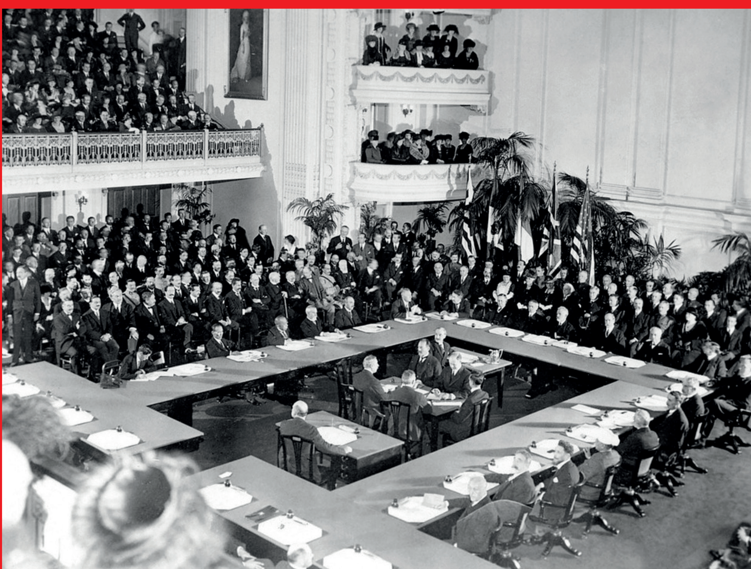
Obrady konferencji pokojowej w Paryżu, 1919 r.