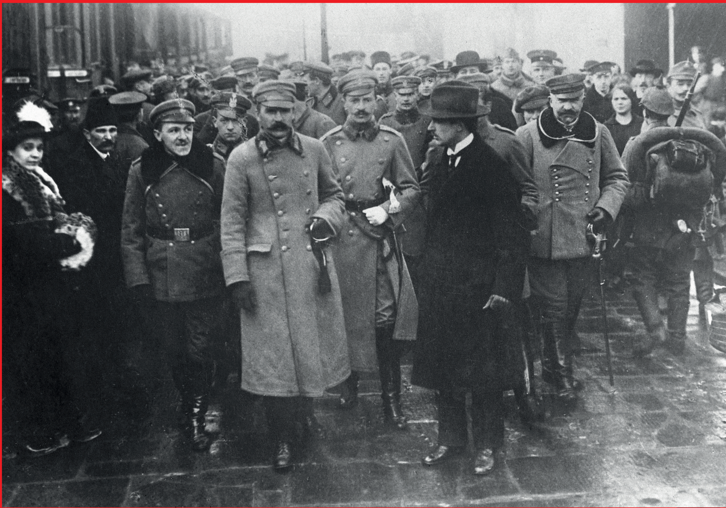
Powitanie Józefa Piłsudskiego w Warszawie po przybyciu z Krakowa, 12 XII 1916 r.

przyjazd Józefa Piłsudskiego do Warszawy