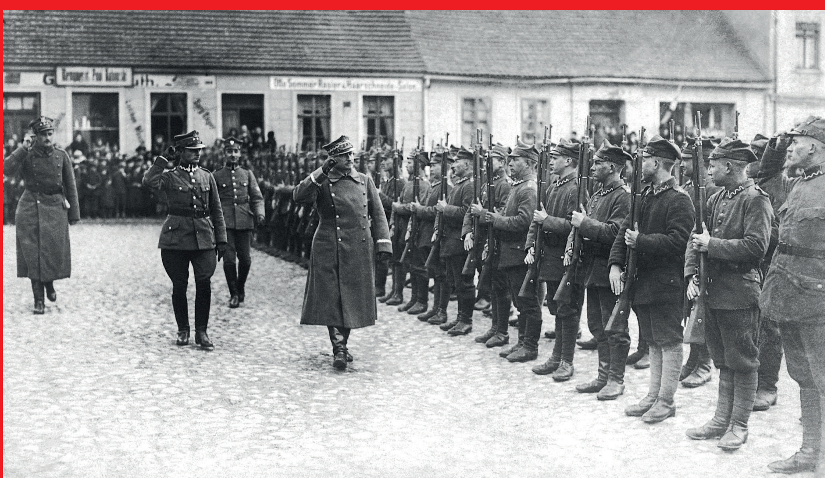
General Józef Dowbor-Muśnicki podczas przeglądu 7. Pułku Strzelców Wielkopolskich w trakcie powstania wielkopolskiego, 1919 r.

wysłanie przez Józefa Piłsudskiego do światowych przywódców telegramu notyfikującego powstanie niepodległego państwa polskiego