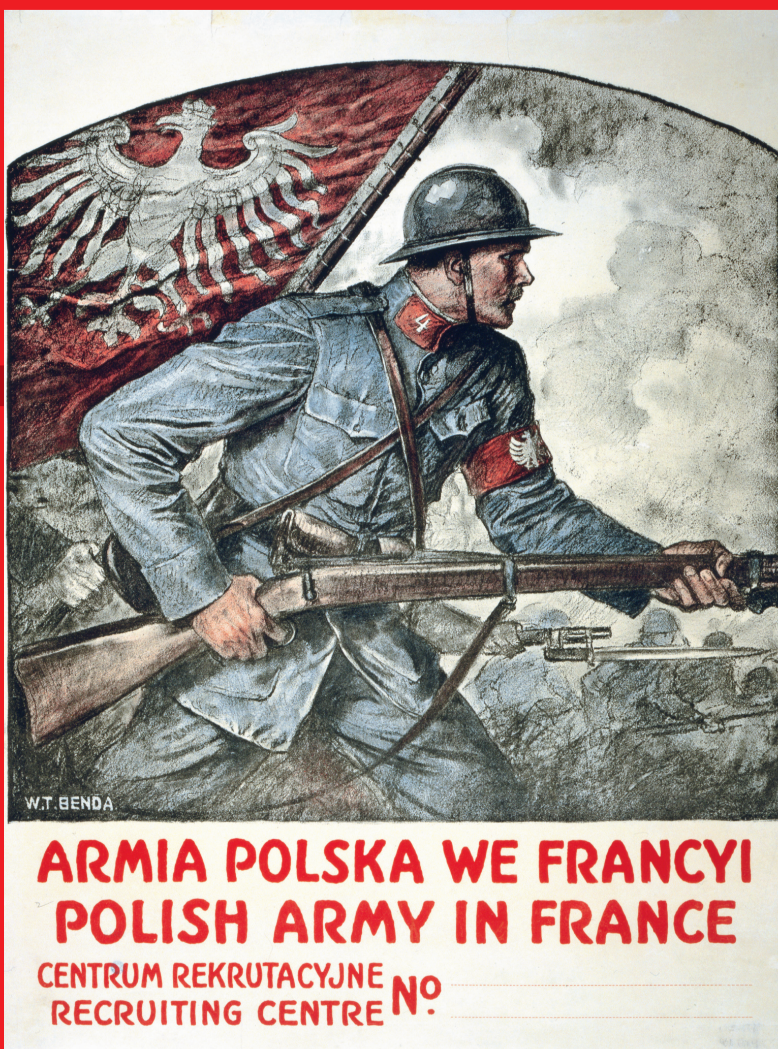
Afisz propagandowy Armii Polskiej we Francji autorstwa Władysława T. Bendy

powstanie Naczelnej Rady Ludowej, polskiej organizacji politycznej zaboru pruskiego