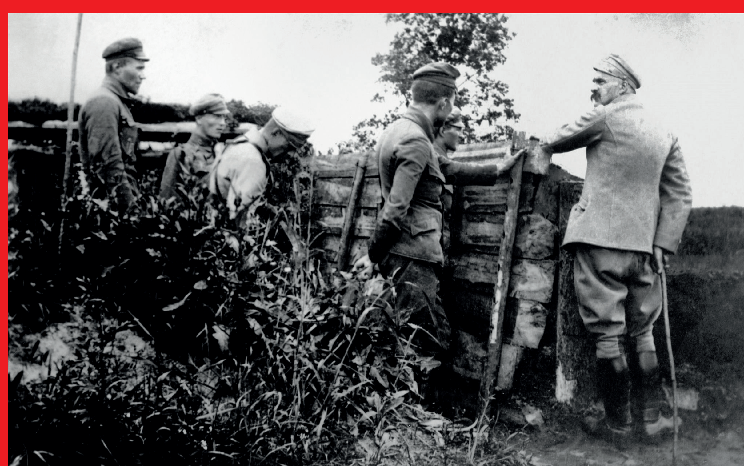
Walki I Brygady Legionów Polskich pod dowództwem Józefa Piłsudskiego nad Nidą w 1915 r.